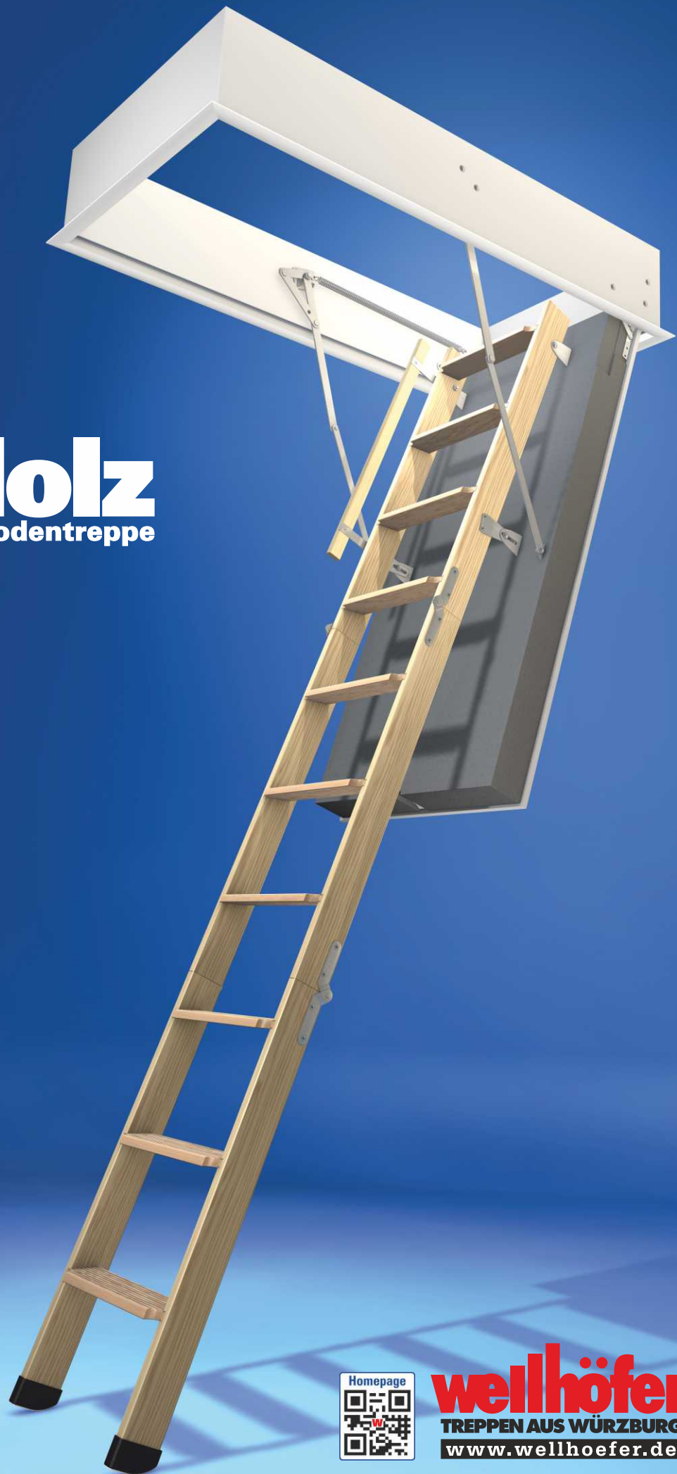
Abbildung zeigt Bodentreppe GutHolz mit Wärmeschutz WS4D und Handlauf