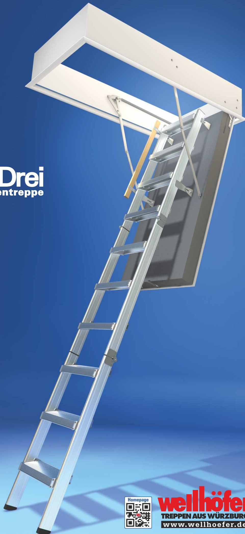
Abbildung zeigt Bodentreppe AluDrei mit Wärmeschutz WS4D und Handlauf